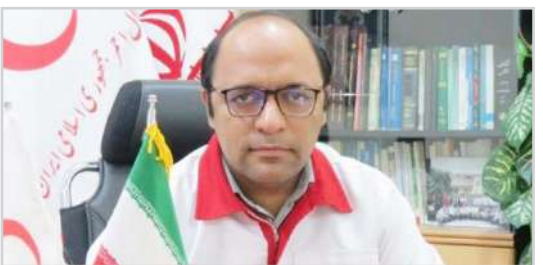
مدیر عامل جمعیت هلال احمر استان هرمزگان:

دوشنبه ۲۷ اردیبهشت ماه ۱۴۰۰ / سال دوم / شماره ۳۴ / ۱۷ May ۲۰۲۱ / ۵ شوال ۱۴۴۲ / صفحه ۸ / قیمت: ۲۰۰۰ تومان