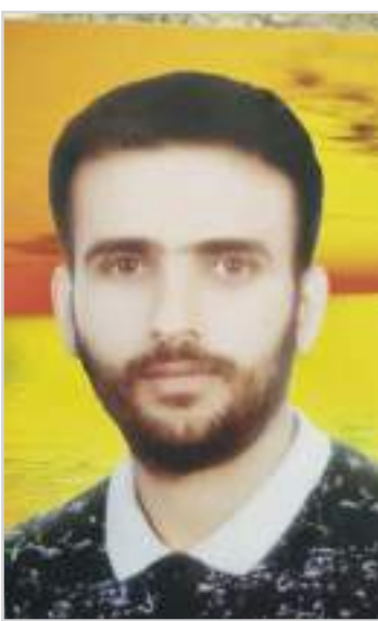
ناشناخته انجام گرفت.

وی خاطر نشان می کند: شاید در روزهای اول کمی تردید در وجودمان بود اما امروز قلبا رضایت داریم و خوشحال هستیم که این کار را انجام داده ایم. اگر فرهنگ سازی شود که زمانی خدایی ناکرده چنین حادثه ای برای خانواده ای اتفاق افتاد، به اهدای عضو رضایت دهند. چه اندازه زیباست که انسانی را به زندگی برگردانیم.