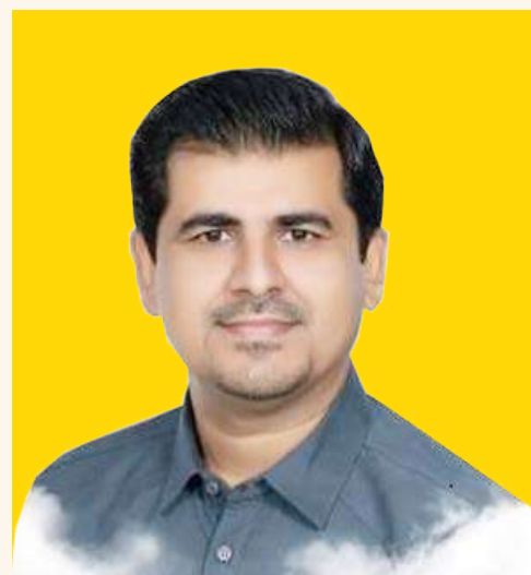
اسماعیل رئیسی حسنلنگی