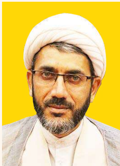
حجت الاسلام احمد عامری سیاهویی