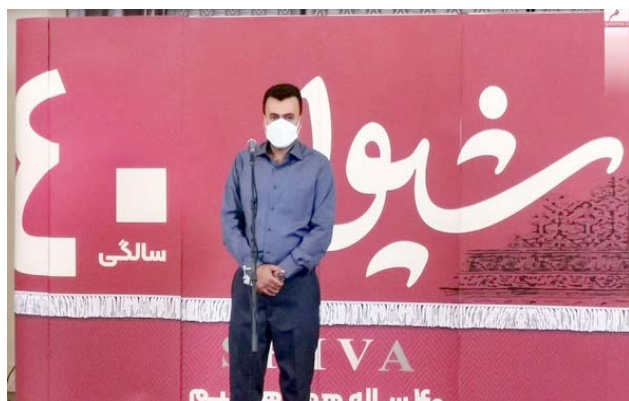
ضمانت فعالیت دارد.

وی اضافه کرد مجموعه شیوا همواره سعی کرده است بهترین برندهای داخلی را برای عرضه به مشتریان خود به خدمت بگیرد و از ۱۰ برند برتر تولیدات فرش، میل و... در کشور در مجموعه خود استفاده کند، در نظر داریم در آینده نزدیک کسب و کار خود را توسعه و برند خود را راه اندازی کنیم و صادرات محصولات خود از جمله فرش، را در برنامه جا دهیم.