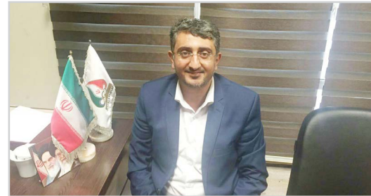
سی و هفتمین شهردار انتخاب شد: