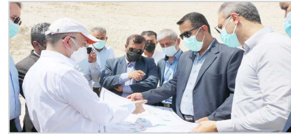
مدیرعامل شرکت آب و فاضلاب هرمزگان:

رفع تنش آبی بستک، تکمیل سامانه آبرسانی چارک به بستک است