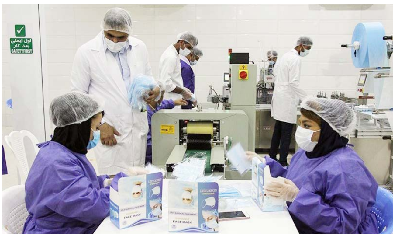
معاون سازمان صحت هرمزگان: