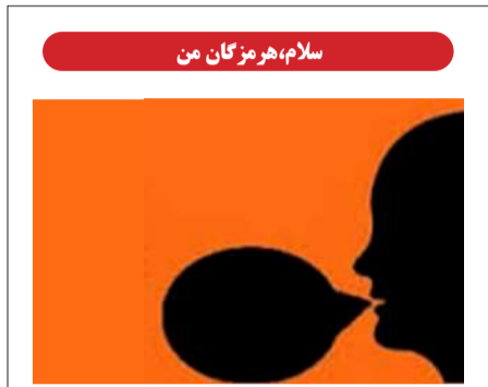
سلام، هرمزگان من

مخاطبان گرامی هرمزگان من، مشکلات شهر و محله خود را به شماره واتساپ ۰۹۹۱۹۱۴۲۹۹۰ ارسال نمایید.