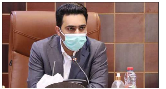
در مانگاه ویژه کارکنان شهرداری بندرعباس احداث می شود

معاون شهردار در گفت و گویی اختصاصی با هرمزگان من از وضعیت ساخت و ساز و ساختمان های فاقد پایان کار می گوید؛