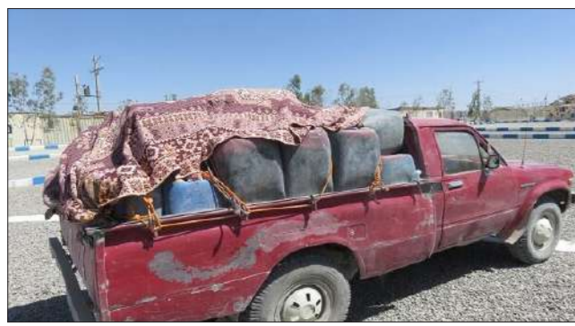
فاجع سوخت جان مردم تو کهور هشتمینی را به خطر انداخته است