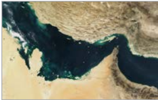
پژوهشگر هرمزگانی به بهانه روز ملی خلیج فارس بیان کرد: