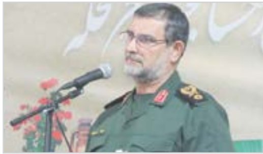
ما خواهان امنیت پایدار در منطقه هستیم