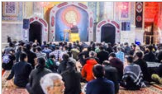
عزاداری هرمزگانی ها در حرم امام رضا(ع) در دهه پایانی صفر