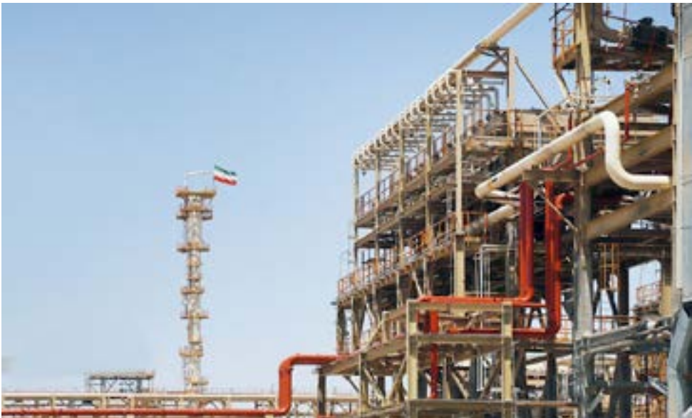
مردمی در حال افزایش است.»