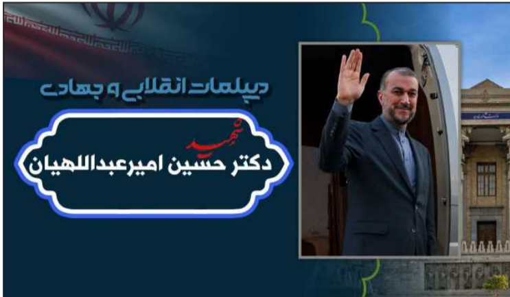
این شهید گرانقدر است.

با توجه به سوابق شهید امیر عبداللهیان و البته رویکرد فکری و شخصیتی وی، در دوره مسئولیت او در وزارت امور خارجه بیش از هر زمان دیگری «پیوند عمیق و معناداری میان میدان و دیپلماسی» رقم خورد که باعث تسهیل و تسریع تحقق اهداف سیاست خارجی جمهوری اسلامی ایران شده بود.