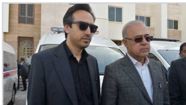
استاندار: نهضت سلامت هرمزگان با الحاق ۳۹ آمبولانس شتاب گرفت