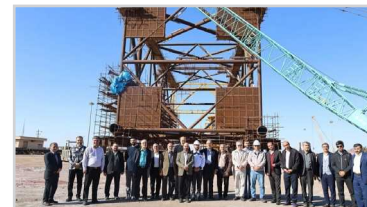
آغاز اردوهای راهیان پیشرفت اساتید دانشگاه‌های کشور در ایزوایکو

یکشنبه ۱۴ دی ماه ۱۴۰۴ / سال ششم / شماره ۱۹۰ / ۴ - January ۱۵ / ۲۰۲۶ رجب ۱۴۴۷ / صفحه / قیمت: ۲۰۰۰ تومان