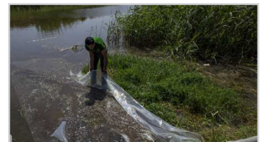
رها سازی ماهی «آفانیوس» برای مبارزه بیولوژیک با بیماری تب‌دنگی