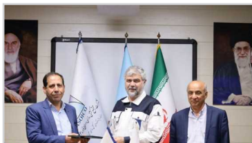
تفاهم‌نامه همکاری دریا محور ایزو ایکو با دانشگاه‌های هرمزگان

پنجشنبه ۳۰ دی ماه ۱۴۰۴ / سال ششم / شماره ۲۰ / ۱۹۲ January ۲۰ / ۲۰۲۶ رجب ۱۴۴۷ / صفحه / قیمت: ۲۰۰۰ تومان