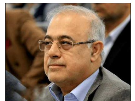
هرمزگان من - استاندار هرمزگان گفت: با واردات برخی از کالاهای اساسی از افزایش قیمت‌ها جلوگیری می‌کنیم.

محمد آشوری، استاندار هرمزگان در جلسه کارگروه طرح ملی اصلاح نظام یارانه‌ای گفت: به مردم اطمینان می‌دهیم که هر روز با نظارت بر بازار قیمت کالاهای اساسی را متعادل می‌کنیم. محمد آشوری گفت: تاکنون بیش از ۱۴۹ هزار خانوار هرمزگانی از اعتبار طرح کالا برگ یک میلیون تومانی استفاده کردند. وی با اشاره به متصل بودن ۳ هزار و ۸۸۴ فروشگاه به طرح کالا برگ افزود: برای کاهش هزینه‌های آمد و شد در تلاش هستیم تعداد فروشگاه را بیشتر کنیم. استاندار هرمزگان گفت: در آینده با افزایش درآمد دولت، اعتبار ماهانه یک میلیون تومان برای هر نفر بیشتر خواهد شد.