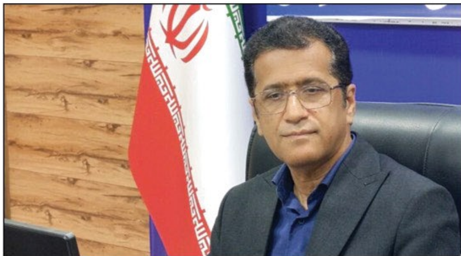
مدیر کل آموزش و پرورش استان هرمزگان تاکید کرد؛