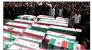
هرمزگان بعد از تهران بیشترین آمار شهدا را در جنگ تحمیلی داشته است