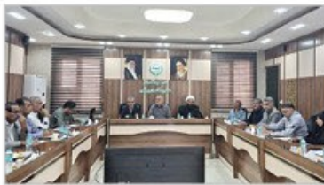
بایستاری ذخایر کالاهای اساسی در هرمزگان

پنجشنبه ۲ اردیبهشت ماه ۱۴۰۵ / سال هفتم / شماره ۲۰۲ / ۲۳ April ۲۰۲۶ / ۵-۵ ذی القعدة ۱۴۴۷ / ۸ صفحه / قیمت: ۲۰۰۰ تومان