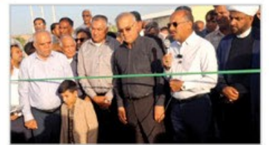
افتتاح پل ماشنگی مسیر ارتباطی ۲۶ روستا را پایدار کرد