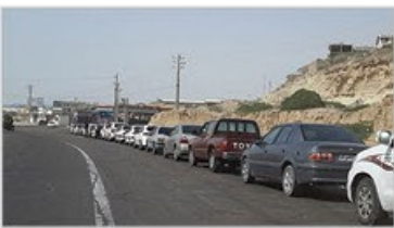
سه‌میه فعلی بنزین، پاسخگوی نیاز روستاییان نیست

پنجشنبه ۷ خرداد ماه ۱۴۰۵ / شماره ۲۸ / ۲۰۲۶ May ۲۸ / ۲۰۲۶ / ۱۱ دی الحجه ۱۴۴۷ / ۸ صفحه / قیمت: ۲۰۰۰ تومان